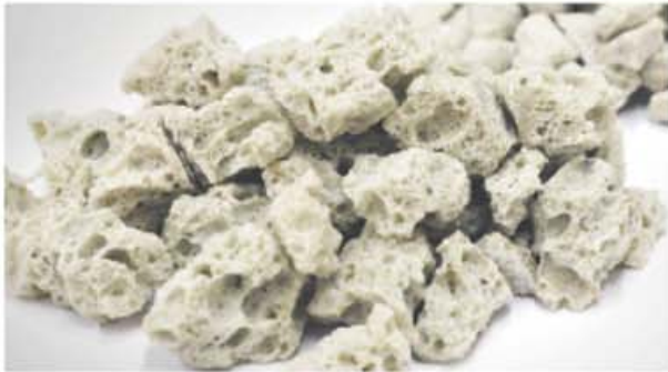
特殊多孔質発泡ガラス材

※まれに水に浮く粒がありますが、ほとんどは時間をかけて沈みます。水に浮いても効果は変わりません。